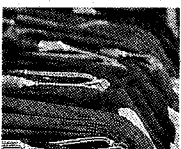
Aiuti agli Ordini

Gli accordi di programma con i vari ordini hanno portato a stilare un bando per il 2010 nel quale si prevede di finanziare psicologi, avvocati, medici, ingegneri e - insomma - un po' tutti gli ordini e i collegi professionali. Oggetto del finanziamento sono corsi di ogni tipo, dai 5 mila ai 30 mila euro di costo. Per la verità la Provincia ha anche imposto una sforbiciata a molte richieste dei vari ordini che avevano fatto lievitare troppo le richieste di sostegno.