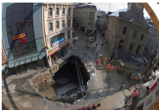
Metro Tunnel Linie 2 , Lausanne/Losanna 2005